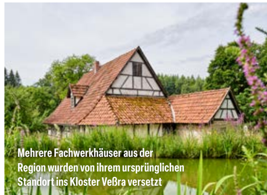
Mehrere Fachwerkhäuser aus der Region wurden von ihrem ursprünglichen Standort ins Kloster Veßra versetzt

Die kleinen Museumsgäste kommen im Kloster Veßra ebenfalls auf ihre Kosten. Die „Spielscheune“ mit Rutsche und Sandkasten, die „Kindermedienlaube“, der Traktor-Parcours